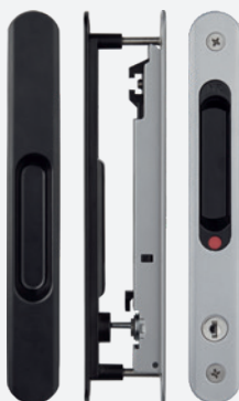
DUPLO 4309 C