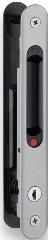
4309 C DUPLO