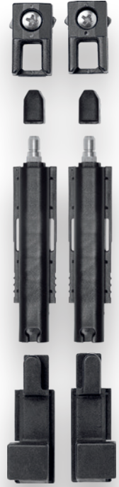
KIT CE PONT. 510