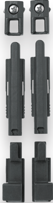
KIT CE PONT. 503