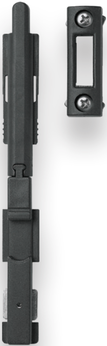
FECHO CE 2.ª FOLHA PONT. 503