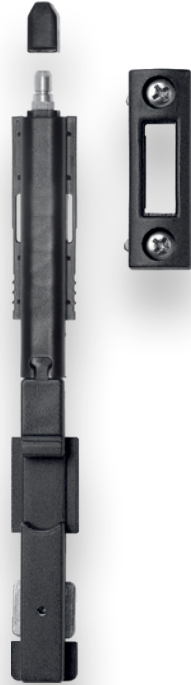
FECHO CE 2.ª FOLHA PONT. 510