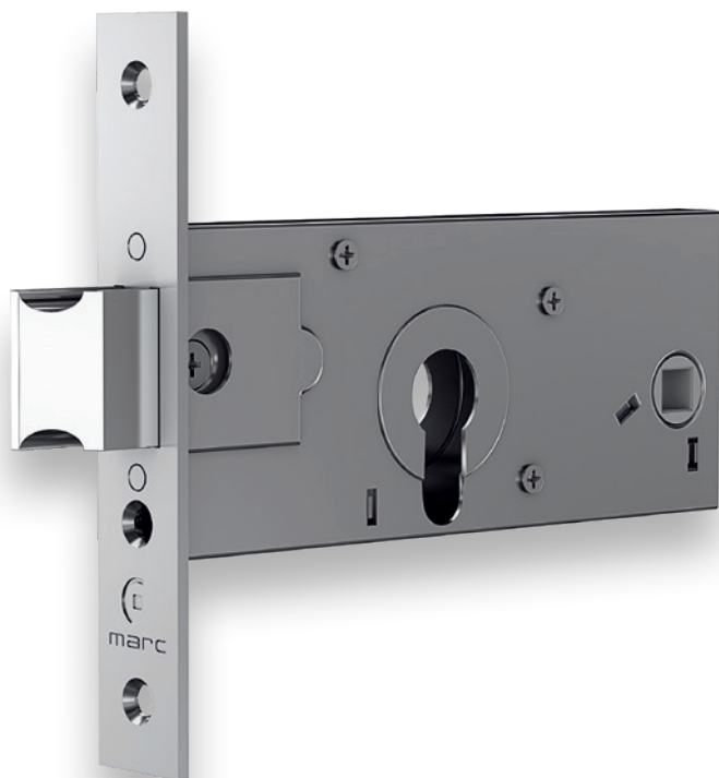
727 FECHADURA S/ CILINDRO min. 60 un.