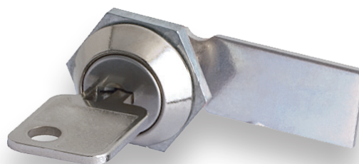
280 FECHO min. 50 un.