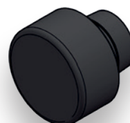
TOPO NYLON (MR0073 - PRETO) (MR0074 - BRANCO)