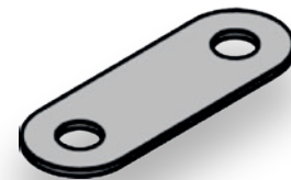
CALÇO PONTO FECHO (MR0069)