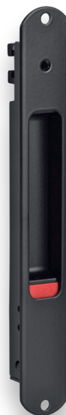
2170 / 2171